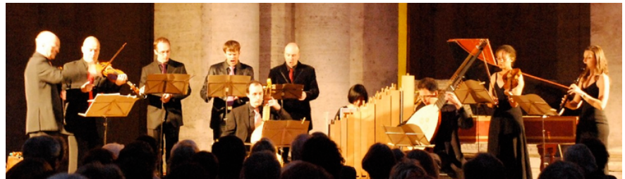
Motets de Charpentier, Cour du Palais Farnèse à Rome